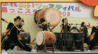
(青少年の手づくりによるステージ発表)