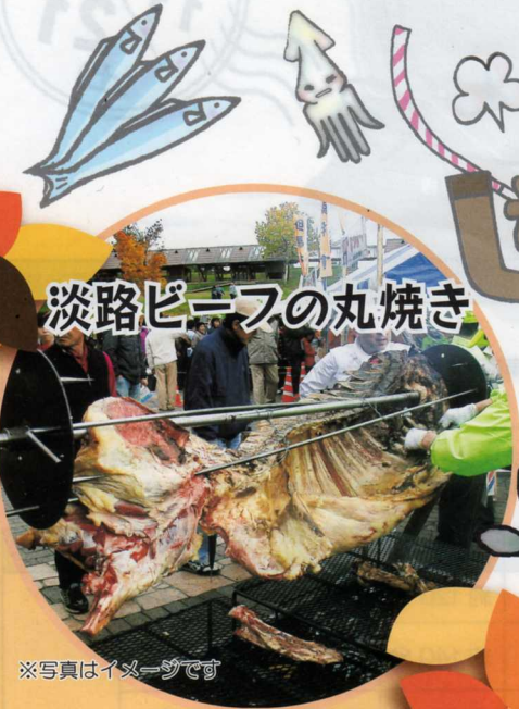
淡路ビーフの丸焼き